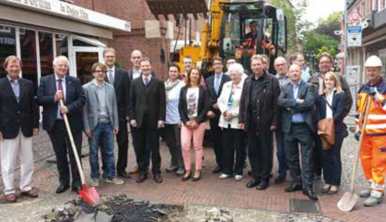
1. Spatenstich Baustelle Dufkampstraße mit Anliegern